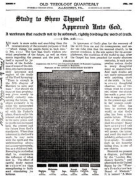
Study to Show Thyself Approved Unto God. Christendom in Grave Danger. Refrain Thy Voice From Weeping. Hope for the Innumerable Non-Elect

Nosił on tytuł: Old Theology Quarterly No. 69, Study to Show Thyself Approved Unto God. Christendom in Grave Danger. Refrain Thy Voice From Weeping. Hope for the Innumerable Non-Elect (pol. Studiuuj, by zjednać sobie uznanie Boże. Chrześcijaństwo w poważnym niebezpieczeństwie. Powstrzymaj swój głos od płaczu. Nadzieja dla mnóstwa niewybranych ). Traktat liczył 16 stron.