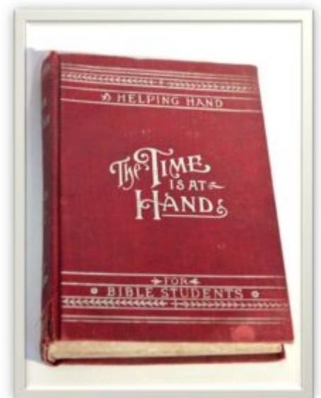
The Millennial Dawn vol. II: The Time is at Hand

W dziele tym pastor Russell zawarł swoje wyjaśnienia na temat czasu i sposobu drugiego przyjścia Chrystusa na ziemię oraz umieścił szczegółowe wywody utożsamiające system papieżstwa z Wielkim Babilonem z Księgi Objawienia. Najważniejszym przekazem książki było głośne ogłoszenie, że od stworzenia pierwszego człowieka Adama do 1872 roku minęło sześć tysięcy lat. Oznacza to, że zaczął się „dzień ucisku”, a bitwa