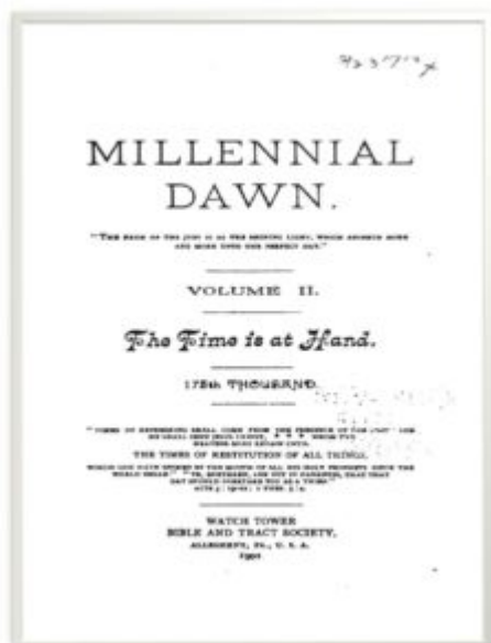
The Millennial Dawn vol. II: The Time is at Hand

Armagedonu „zakończy się w roku 1914 całkowitym obaleniem obecnych mocarzy ziemi”. Książka zawierała wiele odważnych stwierdzeń, dzięki którym zwolennicy poglądów głoszonych przez pastora Russella odnieśli wrażenie, że otrzymali kolejny dowód prawdziwości Boskiego Planu Wieków.