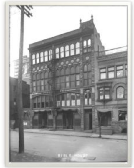
Dom Biblijny w Allegheny

W ciągu roku pastor Russell dostrzegł narastający problem braku wystarczającej ilości miejsca w wykorzystywanym przez stowarzyszenie budynku. Stary dom przy Robinson Street 151 w Allegheny był już po prostu za mały, a pracownicy zastanawiali się nad potrzebą pracy na zmiany. Z tego powodu, Charles już dużo wcześniej, w tajemnicy przed innymi, zakupił działkę budowlaną, wynajął architekta i zlecił rozpoczęcie prac budowlanych. Zdobyte doświadczenie pozwoliło mu dokładnie wyjaśnić architektowi, jakie są potrzeby i wymagania towarzystwa, dzięki czemu mogła powstać nowoczesna siedziba wydawnictwa.